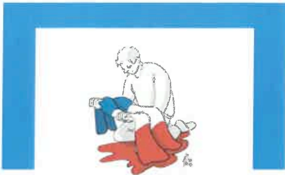
Un dessin de Ken Brechet